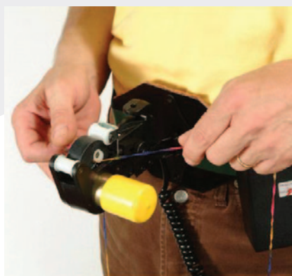
Belt fitting. Applicazione a cintura.