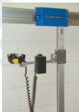
ATS fitting. Applicazione su ATS.